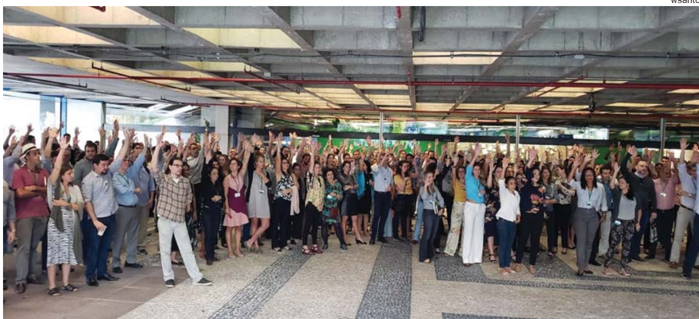
Moção exortando os colegas a não aceitar convite para a chefia do departamento foi aprovada por unanimidade

2017-0). Nenhuma das auditorias ou avaliações indicou qualquer tipo de irregularidades na gestão do Fundo”, escreveu a Associação. “Resumo da história: o BNDES destituiu uma empregada exemplar de suas funções em razão de um blefe do ministro do Meio Ambiente”, complementou a AF.