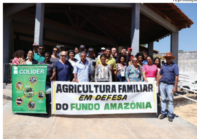
Pequenos agricultores do Projeto Sementes do Portal