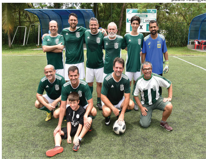
O Natureza será a Seleção da Bolívia na Copa Sensação

O sorteio dos jogadores para a formação das equipes da Copa Sensação de Futebol Soçaite da AFBNDES , conhecido como “mão no saco”, foi realizado domingo passado, no Clube da Barra, obedecendo procedimento