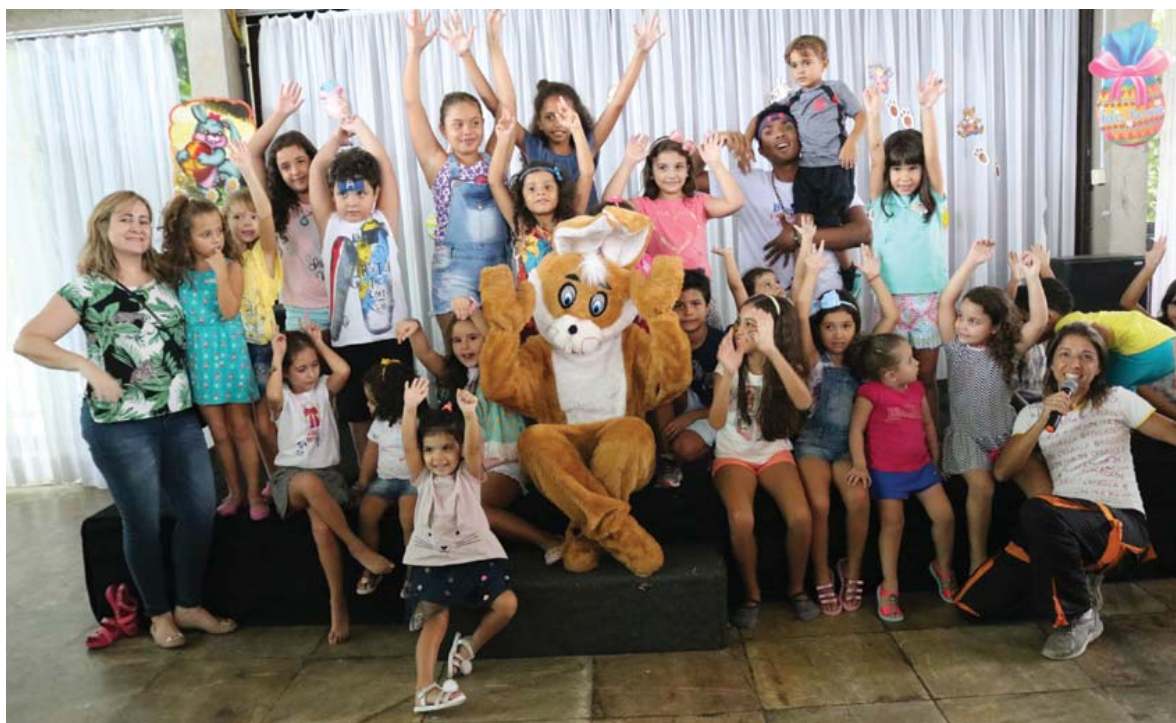
Perto do final da festa, a sempre esperada foto de todos junto ao coelho no palco do salão principal

Nem a chuva, que insistiu em cair durante todo o domingo, tirou a animação das mais de 200 pessoas que se reuniram para celebrar antecipadamente a Páscoa no Clube da Barra. A festa foi embalada pela equipe de recreadores da Brincadeira de Criança, que comandou uma divertida gincana. Teve cabo de guerra, bingo, mímicas, toca do coelho, seu mestre mandou e muito mais. Tudo isso acompanhado de chocolates distribuídos como brinde.