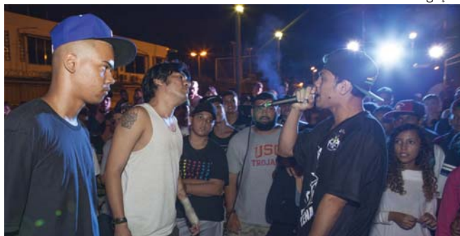
Batalhas de MCs: nas ruas do Rio há mais de 15 anos