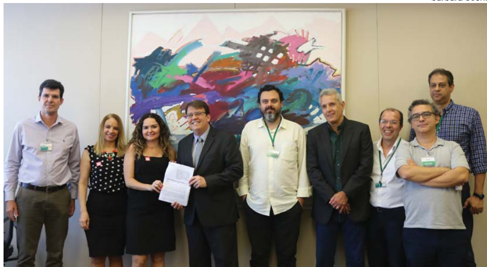
Representantes do Banco e dos empregados na assinatura do ACT 2018-2020

Contribuição negocial —Na AGE do dia 21 também foi aprovada, por maioria dos votos, a contribuição negocial de 1,5% da remuneração contratual de