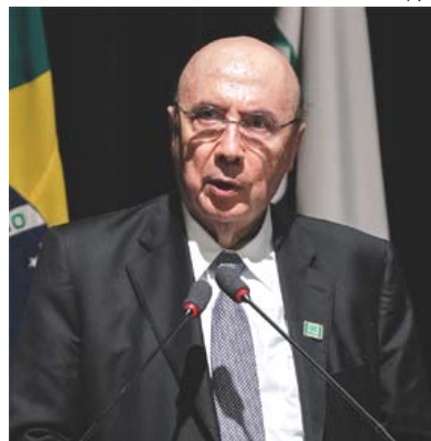
Meirelles na posse de Dyogo Oliveira, em 9 de abril