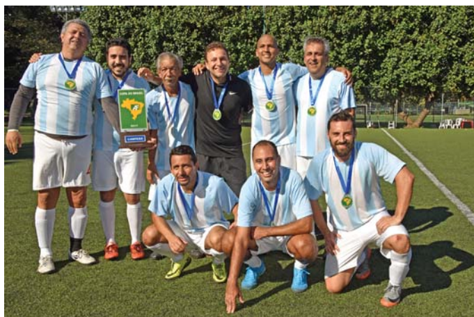
Cruzeiro deu a volta por cima e fez a festa no Clube