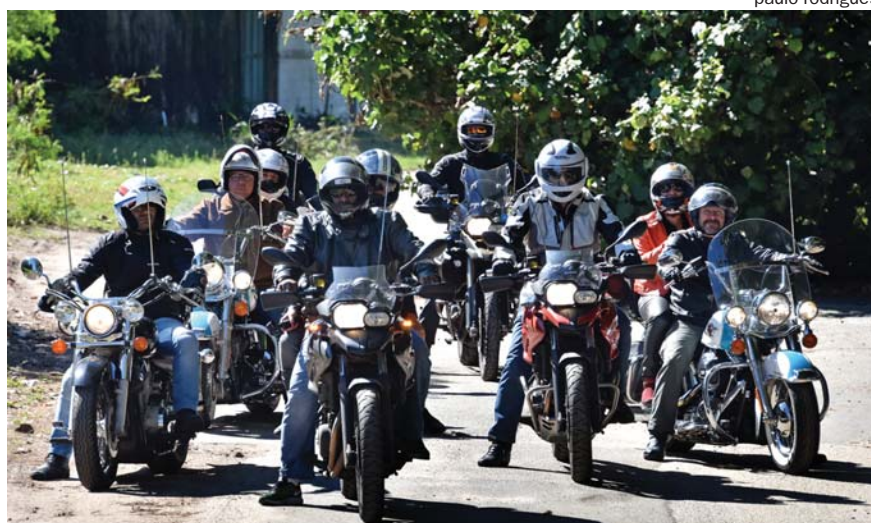
A turma esquentando as máquinas logo após a saída do Clube da Barra