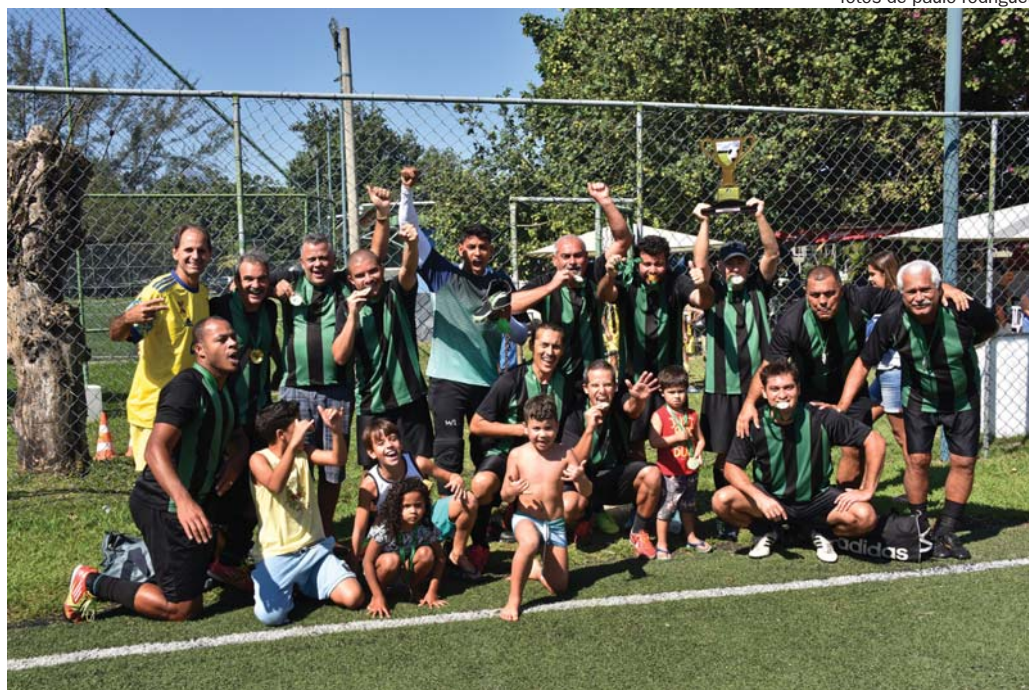
A festa da galera da Chapecoense, no Clube da Barra, com o título do Brasileirão