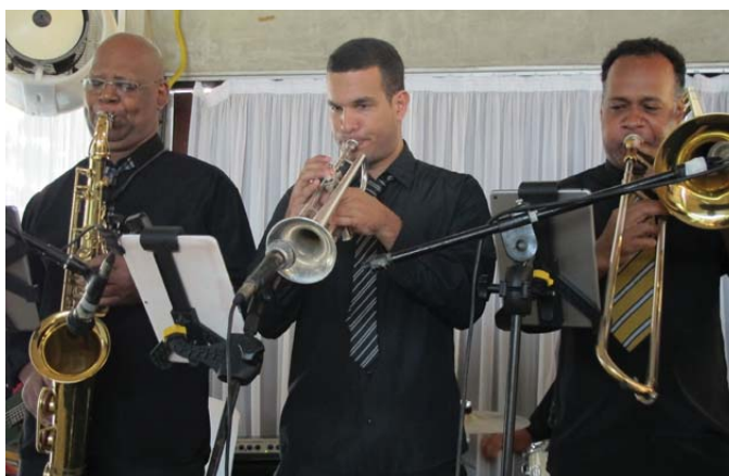
O naipe de sopros da banda “Novos Tempos”: precisão

Imagens – Fotos da festa já estão presentes do site da AFBNDES e na Página da Associação no Facebook.