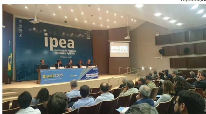
Momento do seminário no Ipea que ocorreu na terça-feira

Diversas instituições estão envolvidas nessa discussão, entre elas a Associação Nacional dos Servidores da Carreira de Planejamento e Orçamento (ASSECOR), o Ipea (Instituto de Pesquisa Econômica Aplicada) e o Centro de Altos Estudos Brasil Século XXI – todas com larga experiência na elaboração e implementação de planos governamentais e políticas públicas. Sem deixar de lado o enfrentamento das urgências conjun-