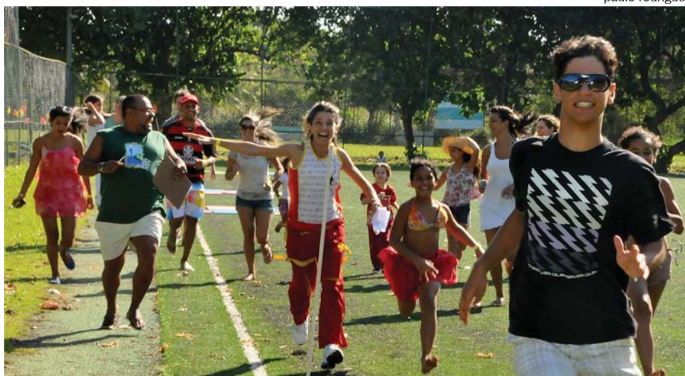
A Caça ao Tesouro que animou a comemoração do Dia dos Pais de 2012 na Barra

Em clima de Olimpíada, a AFBNDES programou para o próximo final de semana eventos em comemoração ao Dia dos Pais no Clube da Barra e na Pousada Itaipava. Para a sede social está programado almoço musical no domingo (14), das 12 às 16h, animado pela DJ Rô Pinheiro, com sistema de comida a peso. As famílias poderão se divertir, das 11 às 17h, numa recreação temática baseada nos Jogos Olímpicos que estão agitando o Rio nos últimos dias. A atividade ficará a cargo da empresa Brincadeira de Criança, bem conhecida da garotada benedense.